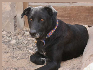
Altay - 6,5 Jahre Mischling (Rüde, kastriert)

Unser größter Wunsch für 2022 - ein Zuhause