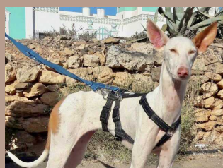
Rosie - 11 Monate Podenca (Hündin, wird kastriert)

Unser größter Wunsch für 2022 - ein Zuhause