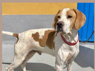
Portos - 3 Jahre Pointer (Rüde, kastriert)

Diese Tiere stehen stellvertretend für all unsere Vierbeiner, welche DRINGEND ein Zuhause suchen.