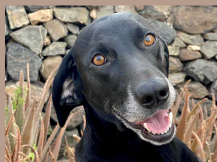
Kiba - 2 Jahre Mischling (Hündin, kastriert)

Unser größter Wunsch für 2022 - ein Zuhause