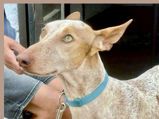
Brandon - 2 Jahre Podenco (Rüde, kastriert)

Diese Tiere stehen stellvertretend für all unsere Vierbeiner, welche DRINGEND ein Zuhause suchen.