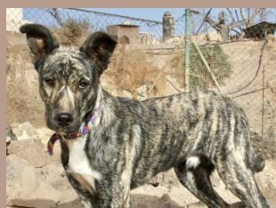
Pepe - 1 Jahr Mischling (Rüde, kastriert)

Diese Tiere stehen stellvertretend für all unsere Vierbeiner, welche DRINGEND ein Zuhause suchen.